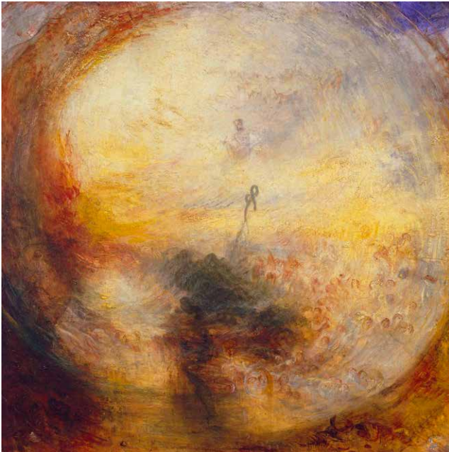
Titelbild: Joseph Mallord William Turner: Light and Colour (Goethe's Theory) – The Morning after the Deluge – Moses Writing the Book of Genesis.

Das Fernstudium richtet sich an alle Interessierten. Dieser Lehrgang möchte auf zugängliche Weise in neue Ansätze der internationalen theologischen Geschlechterforschung und Queeren Theorie einführen und Werkzeuge für das persönliche Leben und Arbeiten, die eigene Spiritualität und das Theologisieren bereitstellen. In diesem Studiengang 2021–2022 wird besonders in diejenigen Ansätze eingeführt, die den Zusammenhang von Macht und Wissen sowie der Konstruktion von Subjekt, Geschlecht und Körper eindringlich veranschaulichen. Neben feministisch-theologischen Diskursen wird die kritische Männlichkeitsforschung erläutert. Es werden Ansätze der Postkolonialen, der Queeren Theorie und der Transgender-Studien kennengelernt. Geschlecht, Sexualität und Sexismus werden wechselseitig beeinflussend mit Rassismus, Nationalismus, Fundamentalismus und Klassismus analysiert. Diese Perspektive hat Einfluss auf Gottesbilder, das Verständnis von Kirche und nicht zuletzt auf ethische Fragen. Das Wissen aktivistischer Bewegungen und theoretisches Wissen sollen gemeinsam ins Gespräch gebracht werden.